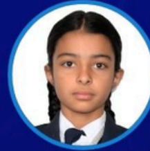
NIYATI VII A AD.NO - 5765

The DEAR program is a great initiative taken by our school. It gives us a chance to take a break from our regular routine and enjoy reading in a quiet and peaceful environment. Reading in the last 15 minutes of school helps us relax and end the day on a positive note.